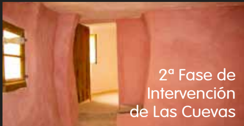
2ª Fase de Intervención de Las Cuevas