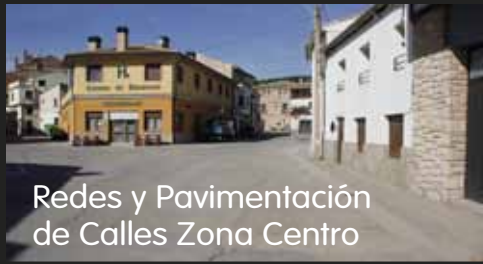
Redes y Pavimentación de Calles Zona Centro