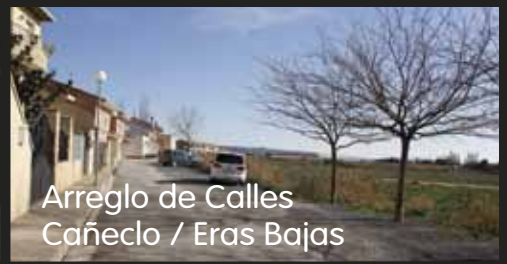
Arreglo de Calles Cañecló / Eras Bajas