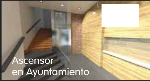
Ascensor en Ayuntamiento