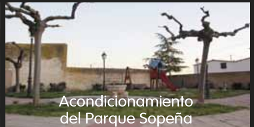
Acondicionamiento del Parque Sopeña