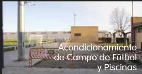
Acondicionamiento de Campo de Fútbol y Piscinas