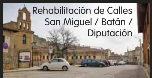
Rehabilitación de Calles San Miguel / Batán / Diputación