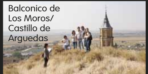
Balconico de Los Moros/ Castillo de Arguedas