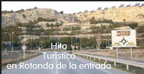
Hito Turístico en Rotonda de la entrada