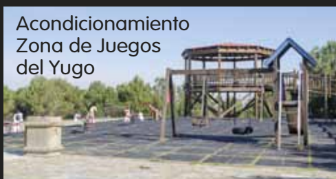
Acondicionamiento Zona de Juegos del Yugo